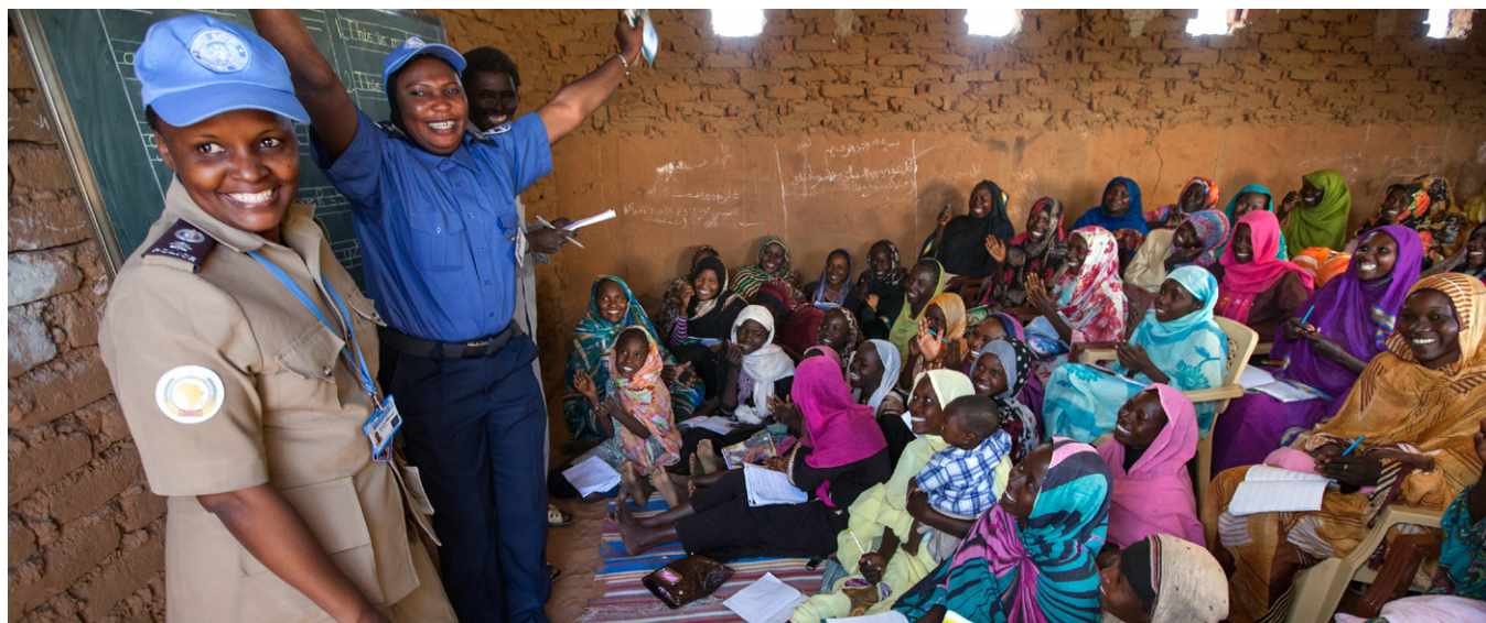
Les femmes du camp d'Abu Shouk, au Darfour, suivent des cours d'anglais dispensés par la police de l'Opération hybride Union africaine-Nations Unies au Darfour (MINUAD).