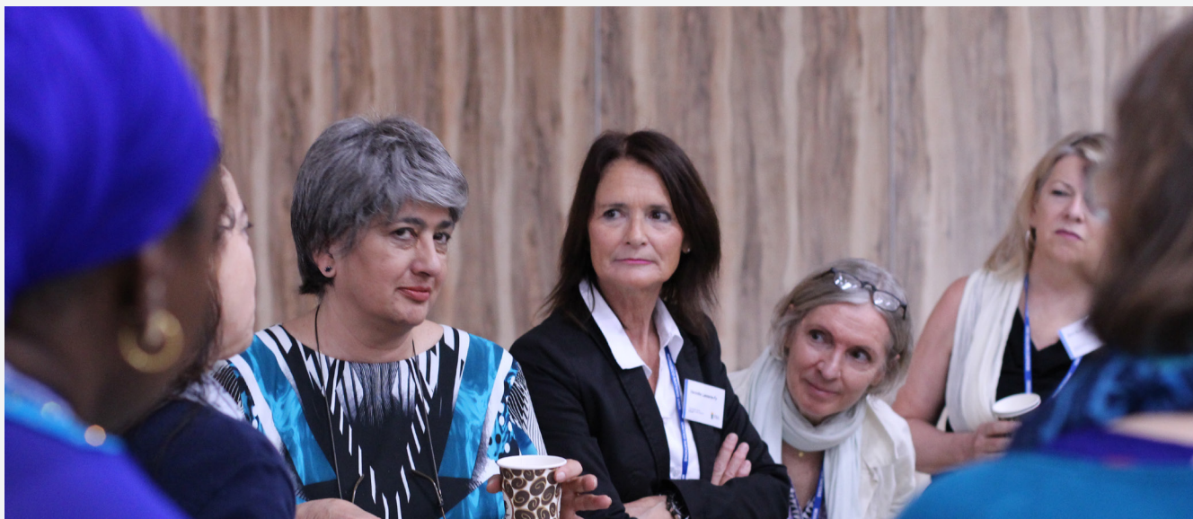
FBA ger stöd till programmet Senior Women Talent Pipeline, där vi utbildar kvinnor från hela världen som ser en framtid som chefer inom FN:s fredsinsatser.