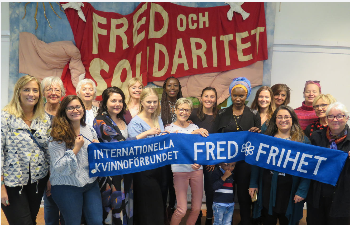
FBA delar ut bidrag till civilsamhällesorganisationer, bl.a. till Internationella kvinnoförbundet för fred och frihet (IKFF)