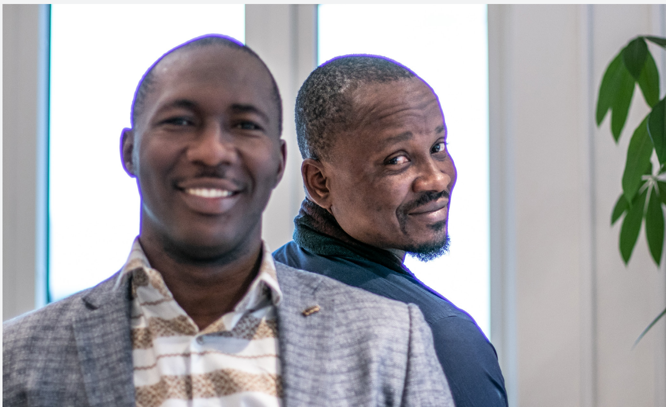
FBA erbjuder kurser i rättstatsuppbyggnad. Deltagarna på bilden är från Liberia, som är ett av våra strategiländer.