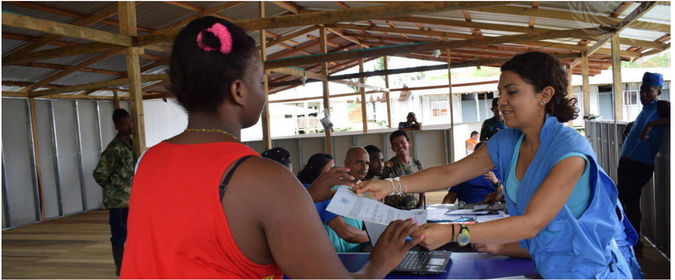
Dans le cadre du processus de réintégration dans la vie civile, les membres des Forces armées révolutionnaires de Colombie (FARC-PE) reçoivent des certificats pour avoir déposé leurs armes individuelles à la Mission de l'ONU en Colombie et une accréditation du Haut Commissariat du pays pour la paix.